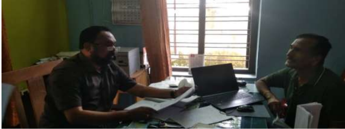
വില്ലേജ് ഓഫീസറുമായി പഠന യൂണിറ്റ് അംഗം ചർച്ച ചെയ്യുന്നു