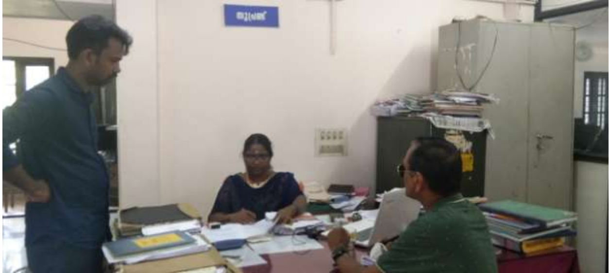
കോർപ്പറേഷൻ സൂപ്രണ്ടുമായി പഠന യൂണിറ്റ് അംഗം ചർച്ച ചെയ്യുന്നു