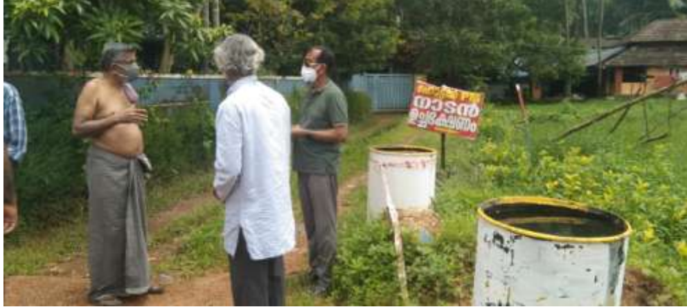
ഭൂവുടമ, റോഡ് വികസന കമ്മിറ്റി അംഗം എന്നിവരോട് കൂടി പഠന യൂണിറ്റ് അംഗം ചർച്ച ചെയ്യുന്നു