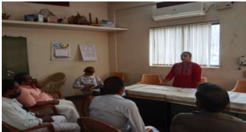
പൊതുകേൾക്കൽ യോഗത്തിന്റെ ചിത്രങ്ങൾ