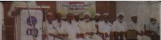
സമരം കേരള മത്സര ഭരണകമ്മിറ്റി അംഗങ്ങൾക്കെതിരെ നടന്ന കമ്മിറ്റി അംഗീകരിച്ച പരിഷ്കാരത്തിന്റെ ഭാഗമായി ഓഫീസ് നിർമ്മാണത്തിന്

സംസ്ഥാനത്തിന് അകത്തും പുറത്തുമുള്ള വിദേശർ അംഗങ്ങളായിരിക്കും. അവയവമാറ്റത്തിന്റെ നടപടികൾ തീരവിൽ എക്കോപിപ്പിക്കുന്നതിനുവേണ്ടി അംഗങ്ങളെ കോളക് കെന്ദ്രീകരിച്ച് പ്രവർത്തിക്കുന്ന കേന്ദ്രമാറ്റമായി ചെയ്യാനാകും പ്രയത്നമുണ്ടാകുമെന്ന് ഇൻസ്റ്റിറ്റ്യൂട്ടിന്റെ പ്രവർത്തനം.