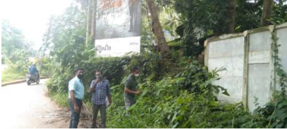
സ്പെ. തഹസിൽദാർ (എൽ.എ), റെവന്യൂ ഇൻസ്പെക്ടർ എന്നിവരോട് കൂടി പഠന യൂണിറ്റ് അംഗം സ്ഥലം സന്ദർശിക്കുന്നു.